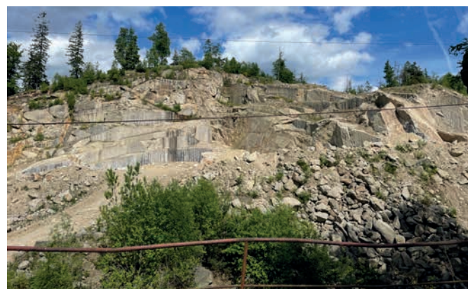
La carrière aujourd'hui