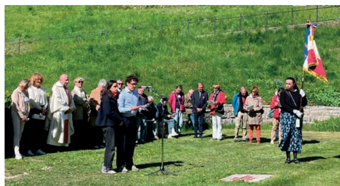
Discours de deux étudiants

Puis deux lycéens lisent un texte émouvant, parlant de la conscience qu'ils ont du devoir de mémoire que nous leur transmettons.