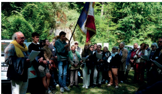
Cérémonie orchestrée par Jean-Marc Piron