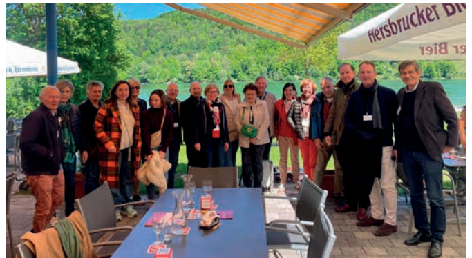
Déjeuner au bord du lac

Nous quittons ce jardin pour aller déjeuner au bord du lac, avant de nous rendre à une autre cérémonie à Happurg, bourg en bas de la colline que les déportés ont creusée pour cacher les constructions de matériel aéronautique.