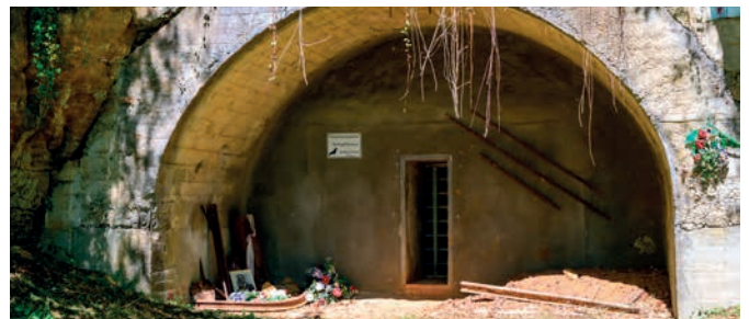
Entrée du tunnel

Les déportés, logés à Hersbruck, devaient traverser la ville à pied sur 5 km, sous l'œil hostile des habitants, qu'il fasse beau ou très froid, dans le même habit ; ils grimpaient sur la colline où les travaux étaient très dangereux : creuser la montagne, installer des rails, pousser des wagonnets.