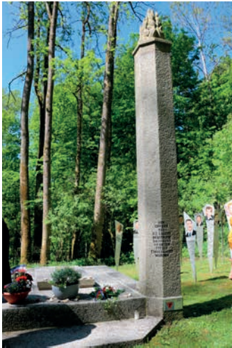
Mémorial de 200 déportés brûlés

Nous montons dans le car pour nous rendre à Hersbruck où nous nous retrouverons tous. Avant d'arriver dans la ville, nous faisons un arrêt au bord d'une route, nous nous enfonçons dans la forêt pour arriver dans une clairière où se dresse une stèle rappelant que là, 200 corps de déportés ont été brûlés. Minute de silence, dépôt d'une gerbe de fleurs, beaucoup d'émotion partagée avec les personnes présentes dont les proches sont morts dans ce Kommando.