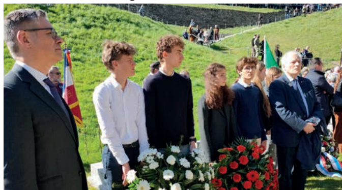
Gerbes déposées par 4 jeunes français, présents pour une semaine d'échanges sur le Mémorial, avec d'autres jeunes étrangers

La 2 ème motivation est pour le peuple allemand d'aujourd'hui et parmi eux ceux qui se sont engagés dans ce travail de conservation de ces lieux de souffrance. Ce travail de mémoire réalisé par le peuple allemand doit être reconnu, accompagné et respecté par nous les descendants. Des lieux de mémoire sans visiteur sont voués à disparaître. Et notre association française sait combien il a été difficile et souvent conflictuel d'arriver à ce qui existe aujourd'hui. Les survivants auraient souhaité que tout reste en l'état, la démarche allemande est plus aseptisée. Nous pouvons probablement le comprendre tant le passé est dur à porter pour les générations actuelles. L'essentiel est que les lieux de mémoire existent et soient entretenus notamment ici à Flossenbürg qui voit aujourd'hui son importance s'accroître avec l'entrée dans son périmètre de responsabilité de la carrière et des bâtiments techniques utilisés par les SS. Cette décision 80 ans après, était essentielle pour nous et c'est chose faite aujourd'hui, même s'il y a encore de nombreuses étapes pour concrétiser ce projet en mémoire des souffrances arbitraires que les déportés ont subies dans ces lieux et des nombreuses vies qui se sont achevées au milieu de ces blocs de granit.