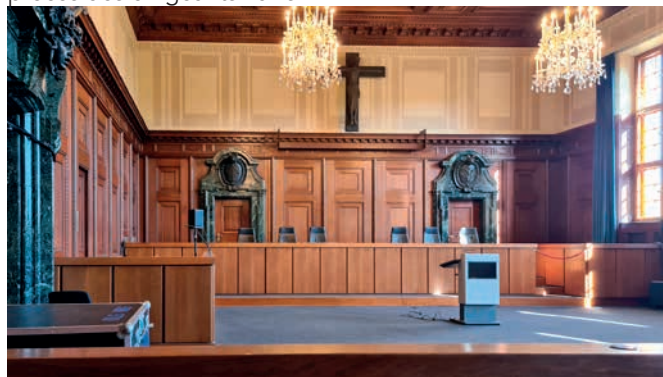
Tribunal de Nuremberg

Après le déjeuner où nous avons dégusté les délicieuses saucisses de Nuremberg, nous avons suivi nos guides et visité la vieille ville et terminé par le Tribunal de Nuremberg où s'est tenu le procès des dirigeants nazis.