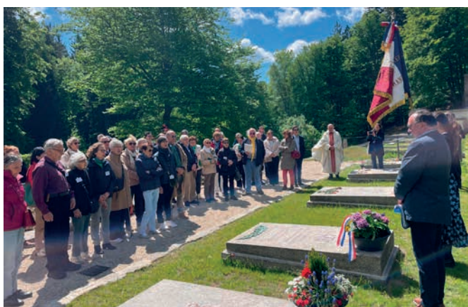
La Marseillaise devant la stèle de nos déportés français

Puis nous sommes allés nous recueillir devant la stèle de nos déportés français et avons chanté la Marseillaise.