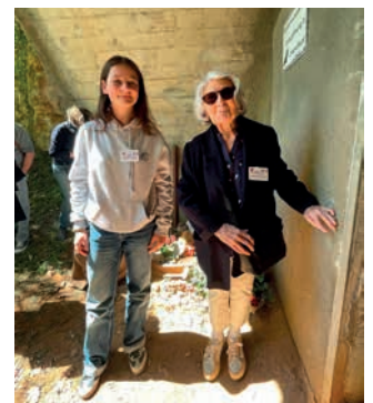
Notre doyenne et la benjamine du groupe devant l'entrée du tunnel