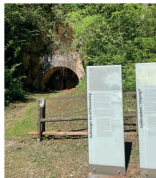
Entrée du tunnel