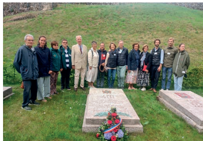
Pèlerinage Juillet 2025