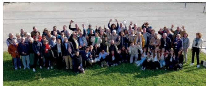
Photo finale des pèlerins 2025