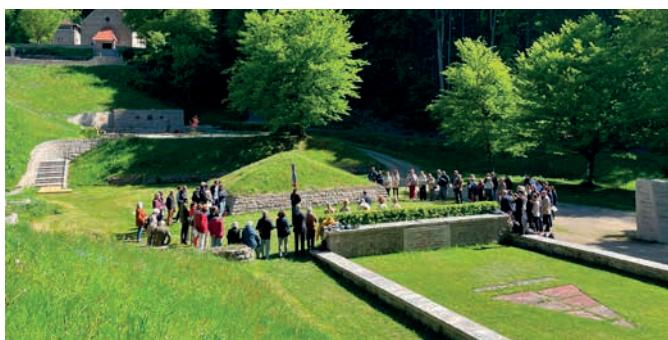
Discours devant la pyramide des cendres

Départ de l'hôtel pour Flossenbürg. Difficile lorsqu'on passe à côté de la Kommandantur, d'imaginer l'existence d'un camp de concentration aussi cruel ; quand on voit ce beau jardin, cette route qui sinue sur la place d'appel, ces coquettes maisons là où il y avait les baraquements des déportés. Il reste deux miradors sur le pourtour du camp, les 4 ou 6 autres ont été démolis et les pierres utilisées pour la construction de la chapelle. Il fait beau, la nature est superbe, les oiseaux chantent. Thierry, dans sa tenue dominicaine, nous attend avec Sonia, l'interprète qui a accompagné les lycéens une grande partie des visites successives. Elle est une « pierre » très solide et toujours souriante de la chapelle et de la Gedenkstätte. Une fois passés devant le bâtiment du musée et des douches en sous-sol, nous descendons