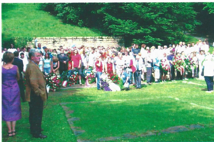
Pèlerinage à Flossenbürg. Cérémonie internationale le 25 juillet 2004