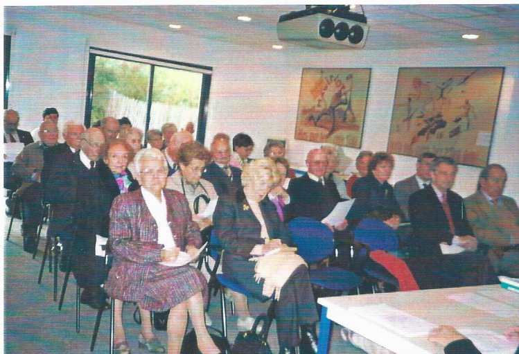
Assemblée Générale «La Coupole» Saint-Omer