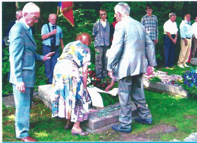
Le dépôt de gerbe sur la dalle Française le 25 juillet 2004.

Tous sont élus ou réélus, à l'unanimité des présents ou représentés.