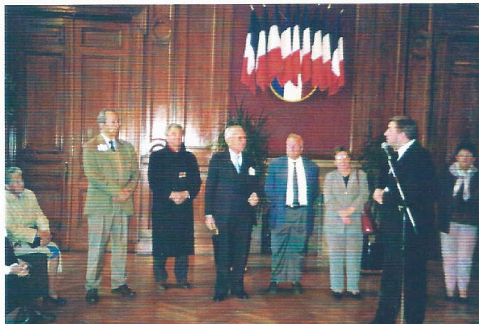
Réception à l'Hôtel de ville de Boulogne sur Mer

Le rapport moral est adopté par l'Assemblée, à l'unanimité.