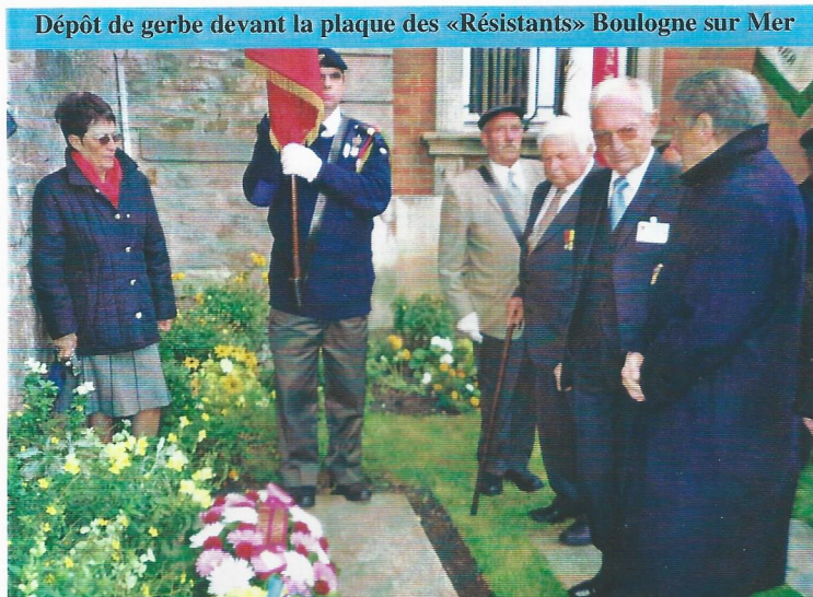
Dépôt de gerbe devant la plaque des «Résistants» Boulogne sur Mer