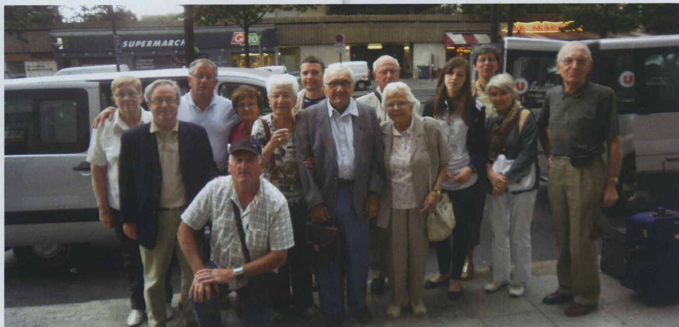
Le groupe des pèlerins

Lundi matin, la découverte de la ville historique de Nuremberg a été l'ultime étape du périple. Du Zeppelintribüne où Hitler haranguait la foule allemande dans les années 1930 au Centre de documentation. Ou encore la Salle 600 du Tribunal où a eu lieu le jugement des hauts responsables nazis en 1945 et 1946. Tout un symbole !