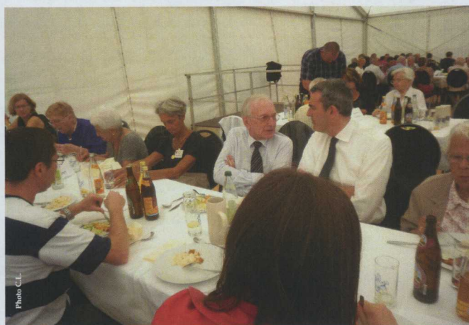
Déjeuner avec le Consul Général