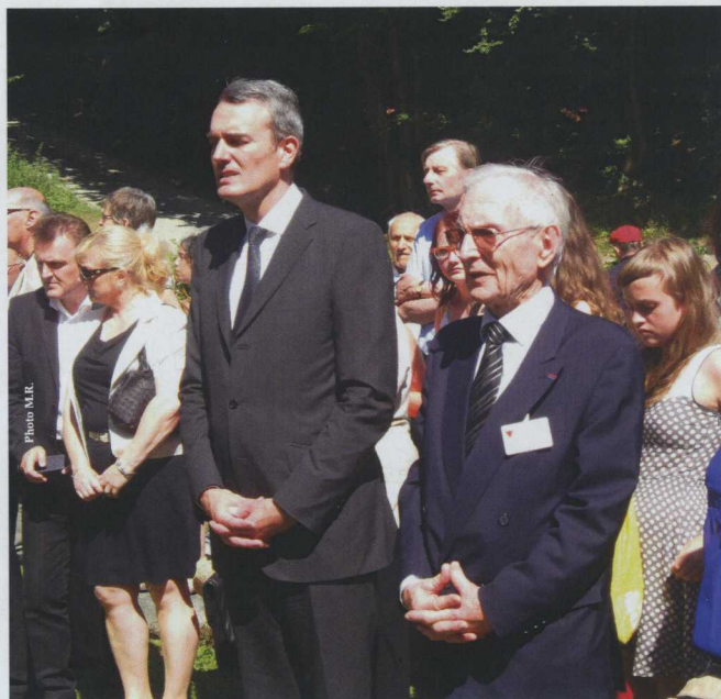
Sur la stèle des Français à Flossenbürg avec le Consul Général

Au cours de l'après-midi, les cérémonies officielles du Souvenir ont clôturé les journées internationales.