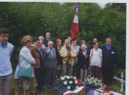
Fin de la cérémonie