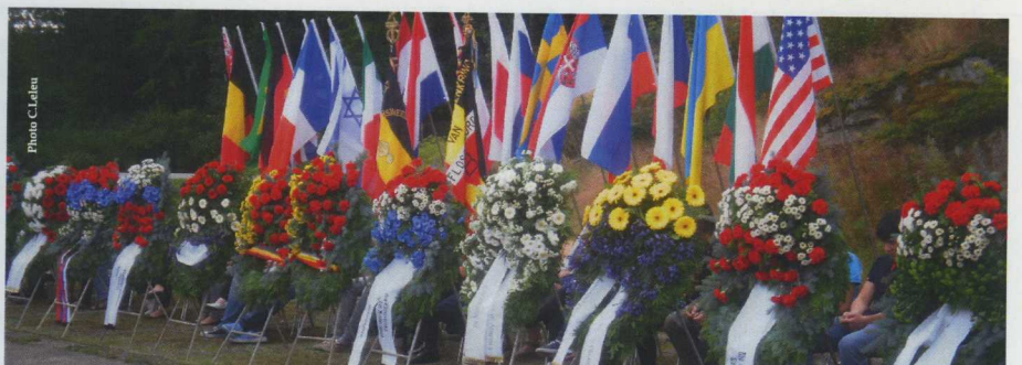
Gerbes des différentes délégations