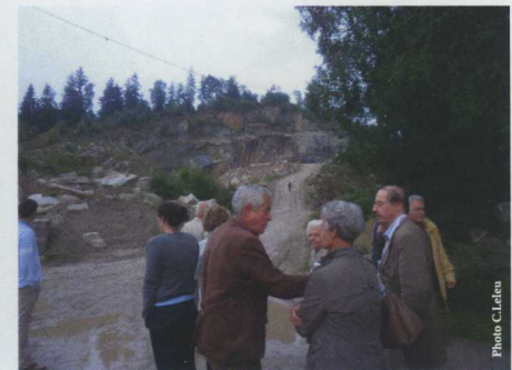
Visite de la carrière