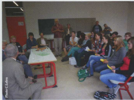
Le groupe d'élèves Hersbruck