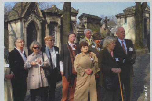
Vue partielle de l'assemblée