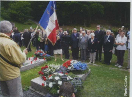
Le consul de France et les participants à la stèle française