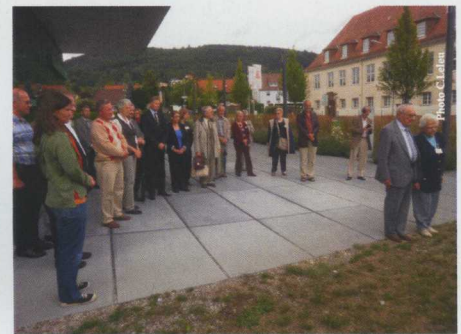
Participation locale à la cérémonie