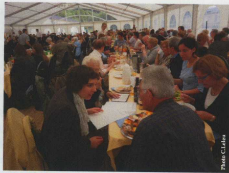
Repas sous le tivoi