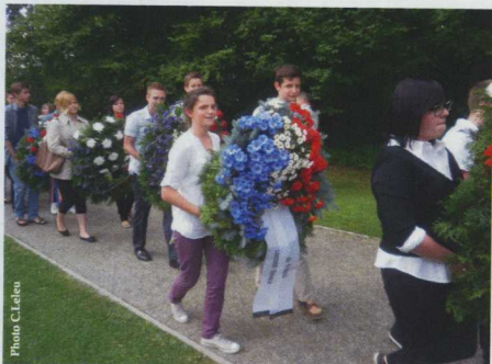
Les porteurs de gerbe