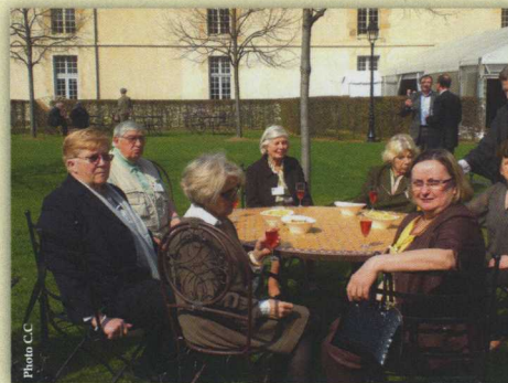
Apéritif Ecole militaire