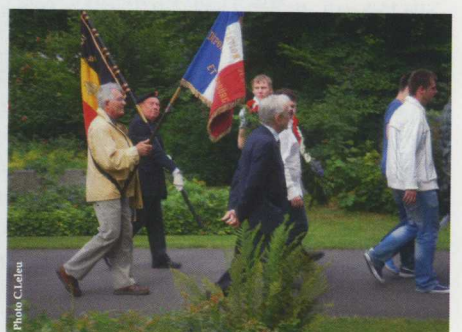
Le drapeau de l'Ass. de Flossenbürg