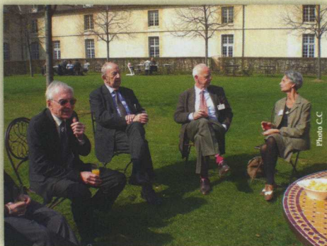
Avant le déjeuner