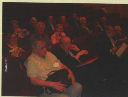
Assistance à L'AG

Cette opération ne pourra être proposée aux membres de l'Association qu'après l'ouverture du site.