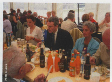
Le consul de France à Munich