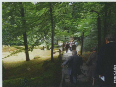
Descente au crématoire de Flossenbürg