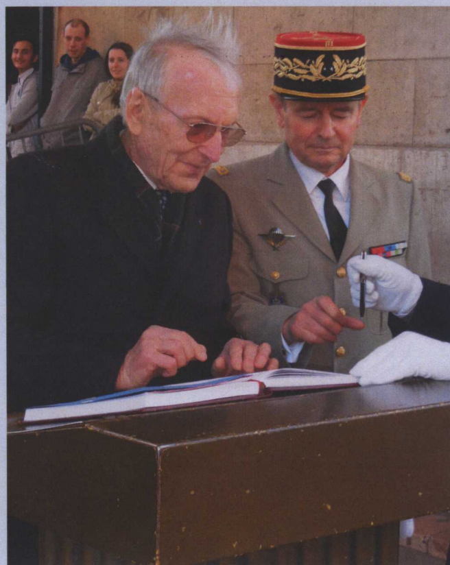
signature du Livre d'Or par le Président